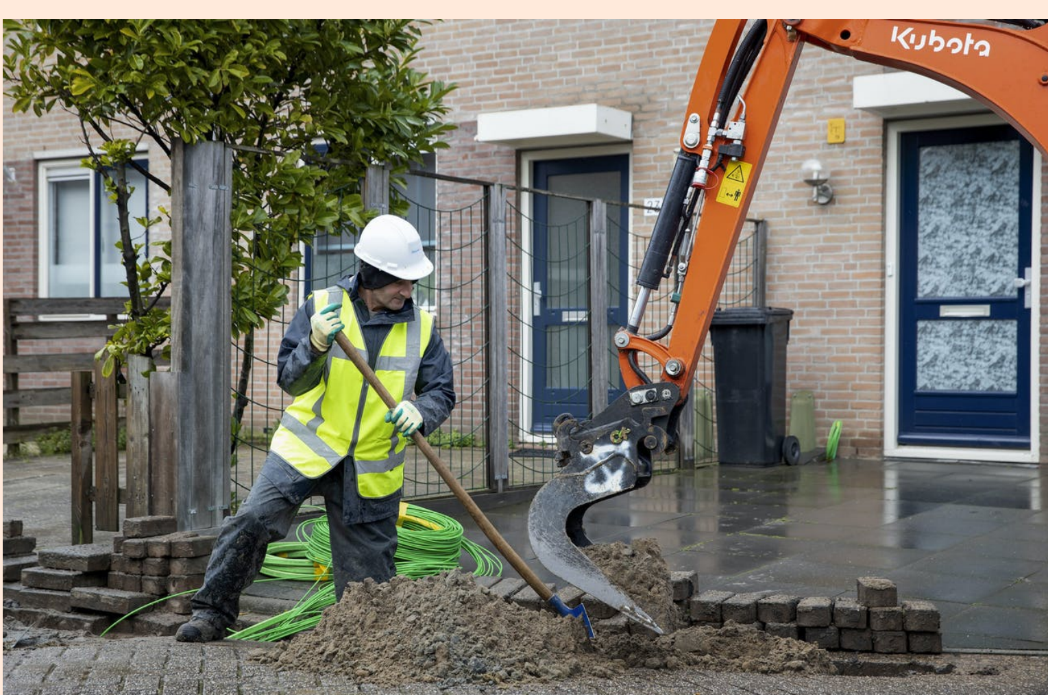
Aanleg glasvezelkabels in een woonwijk in Gouda.